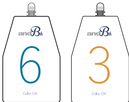
アンドビーカラー2剤 OX6% 2L